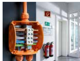
mit Isolations- und Funktionserhalt