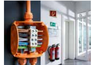
mit Isolations- und Funktionserhalt